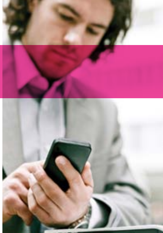
Figura 1. L'offerta Alcatel-Lucent Office Communication Solutions

L'offerta è affidabile, aperta e basata su standard. Alcatel-Lucent Office Communication Solutions è modulare ad ogni livello - dalle suite di comunicazione e le licenze software, ai server di comunicazione e all'infrastruttura di rete, che soddisfano esattamente le richieste dei clienti. I prodotti possono essere acquistati con una garanzia sull'hardware ed una varietà di servizi, che variano da un semplice contratto di manutenzione all'aggiornamento completo del sistema con nuove applicazioni e tecnologie. Alcatel-Lucent Office Communication Solutions sono pronte per il futuro, perché sono basate su un server di comunicazioni IP che usa protocolli standard e offre numerose potenti funzionalità.